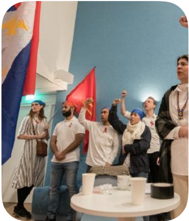
Parangal ng internasyunal na mga kaibigan sa Utrecht, Disyembre 23, 2022 para Ka Joma

Ang masang anakpawis at buong sambayanan na nakikibaka para sa pambansang kalayaan, demokrasya at